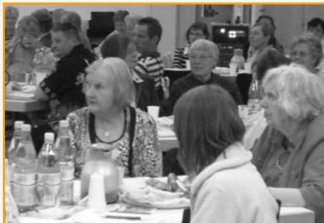
Zahlreiche Mitglieder waren auf der Jahreshauptversammlung

Jugendarbeit ist gerade unter Tier- schutzgesichtspunkten eine ganz wichtige Aufgabe. Es ist nicht zu verheimlichen, dass die Mitgliedschaft der Tierschutzvereine überaltert ist, und zwar weit über das Maß der all- gemeinen Überalterung unserer Ge- sellschaft hinaus. Die Aufgaben des Tierschutzes müssen aber auch in der Zukunft wahrgenommen wer- den. Wenn die Tierschutzvereine keine Mitglieder in der jungen Ge- neration gewinnen, wird ihr Einfluss in unserer Gesellschaft immer geringer.