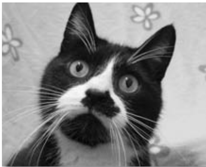
Louis will mit Oldiefreund in ein neues Zuhause

Über eine geräumige Voliere mit vielen Klettermöglichkeiten freuen sich unsere jungen Degus. Die Nager sind sehr lieb und zutraulich und sehr aktiv. Toben und Klettern sind die große Leidenschaft der in Südamerika beheimateten Nagetiere. Neben Heu und Spezial-Degufutter benötigen die temperamentvollen Degus auch Frischfutter wie Schlangengurke und Eisbergsalat. Nur durch eine ausgewogene Ernährung bleiben die zur Diabetes neigenden Nager gesund. Und für die Körperpflege ist das tägliche Chinchilla-Sandbad ein Muss. In einer Familie mit größeren Kindern würden sie sich sehr wohl fühlen.