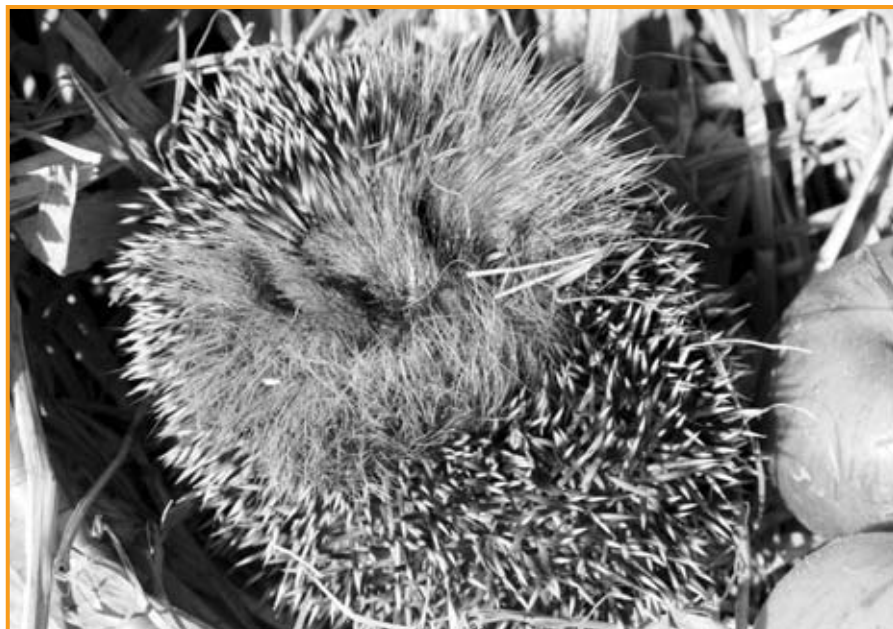
Igel sind Wildtiere und gehören nur in seltenen Ausnahmefällen in Menschenhand.

Igel kann man übrigens sehr helfen, wenn man seinen Garten natur-nah anlegt und nicht zu sehr "aufräumt". Die Tiere verkriechen sich gerne in Reisighaufen oder unter Busche, wo sie auch mit Grashalmen, Blättern und anderen Materialien besagtes Winternest anlegen. Chemie im Garten schadet ihnen. Früher fanden Igel immer wieder den Feuertod, wenn Haufen mit Pflanzenabfällen verbrannt wurden, was heutzutage wegen der Rauchentwicklung verpönt ist. Und bitte, stechen Sie nicht einfach mit der Gabel in Ihren Komposthaufen - Igel halten sich gerne auch darin auf. Es gibt noch eine Möglichkeit, Igel bei der immer schwieriger werdenden Futtersuche im Spätherbst zu unter-