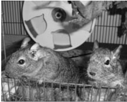
Degus in Aktion